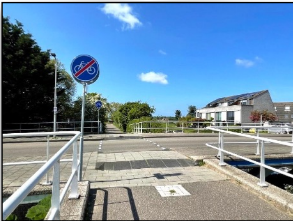
de nieuwe markering en borden op de kruising van het fietspad aan het Henriëtte Bosmanspad met de Heintje Davidsweg (mei 2023).

De grotere knelpunten vragen om een aanpassing van de buitenruimte, bijvoorbeeld het verleggen van het fietspad, het toevoegen van drempels of de kruising anders inrichten. Het afgelopen halfjaar is gewerkt aan de ontwerpen hiervoor. Verder hebben we voorbereidend onderzoek uit laten voeren naar de kabels, leidingen en bomen op die locaties. Momenteel wordt nog onderzocht of de verbeteringen aan het fietsnetwerk kunnen samenvallen met het geplande groot onderhoud aan de wegen en fietspaden in de Stevenshof. Maar voordat de uitvoering start, worden de ontwerpen nog voorgelegd aan de wijkbewoners. Na de zomervakantie communiceren we hier concreet over.